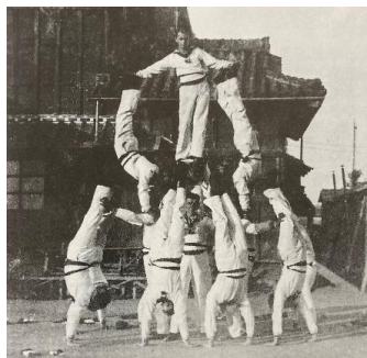
ドイツ兵捕虜による組立体操

本格的な組立体操に取り組まれるようになった時期は定かではありません。しかし、大正初期の徳島県鳴門市で行われていた組立体操の記録が残っています。