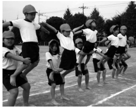
②帆掛け舟だつてできちゃうよ