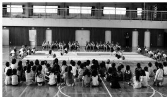
とぶのがだいすき、かえるのピョン