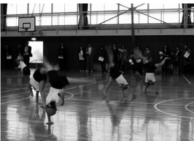
側転でぐるぐるまわる。