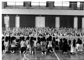
かめさんになって 「ゲーラン、ゲーラン」