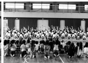
「ブ〜リッジ、あ〜しあげ」