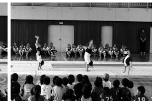
新幹線とびこえるピョン