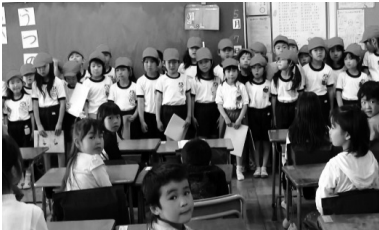
①ごたいめ〜ん「よろしくね」