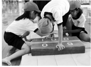
②手・手・足・足のリズムでね