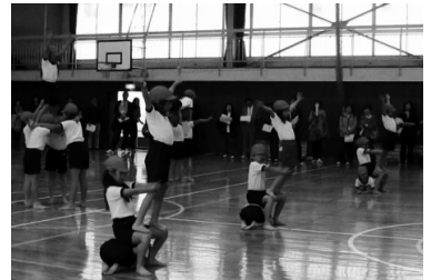
渦巻きにまけない大きな船を作ろう