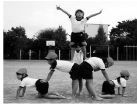
③6年生みたいでしょ