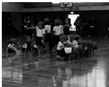
ピラミッドの一番下になる子に セリフを言わせる。