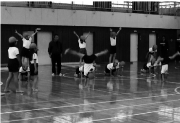
それー、宝島に出発だぁ