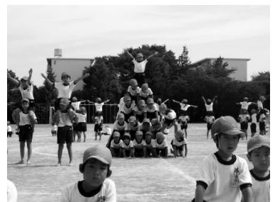
きまつたね。 1・2年生合同の5段ピラミッド

その後、1年生の招待による「お店屋さんごっこ」など、たくさんの交流をしました。この体育のコラボレーション授業はそれこそ、中央小の運動文化の継承、発展となりました。「2年生って頼もしい!」