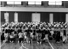
ねこちゃんがおこった 「フーッ、ハッ」