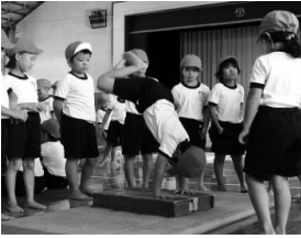
①山とびでリズムチェック