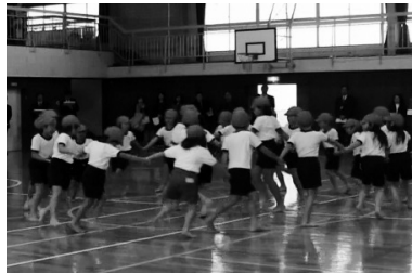
わぁー渦巻きだぁ