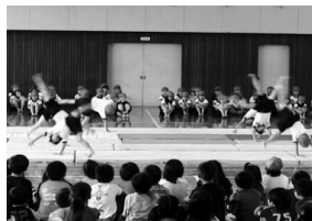
次には自動車とびこえて